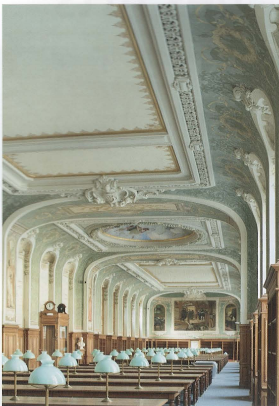
La grande salle de lecture de la bibliothèque de la Sorbonne a retrouvé sa superbe grâce aux travaux de rénovation menés par l'Atelier Mériguet-Carrère en collaboration avec Roubert Ravaux Clément architectes.

la bibliothèque de la Sorbonne se sont terminés, après une remise en teinte des lambris en bois naturel, et un nettoyage des peintures au pochoir et de la petite coupole ornée de scènes peintes. L'atelier a débuté cet hiver la seconde phase du chantier de la villa Cavrois, œuvre de l'architecte Robert Mallet-Stevens, dans le Nord. Après une campagne de sondages destinée à identifier les couches picturales anciennes, il s'agira de recréer les couleurs des murs. G. M.