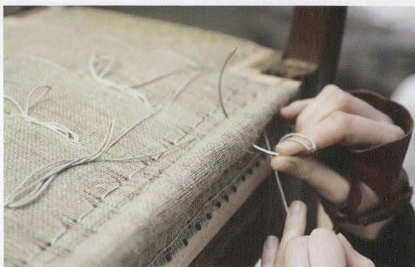
Garniture conservatoire sur châssis amovible pour une chaise conçue par Georges Jacob pour l'hôtel de la rue Chantereine à Paris, première adresse du couple Bonaparte.